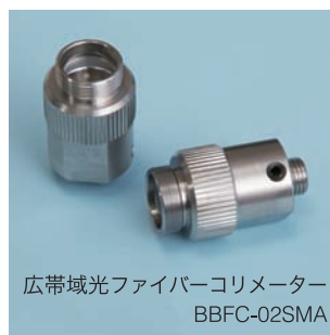
広帯域光ファイバーコリメーター BBFC-02SMA