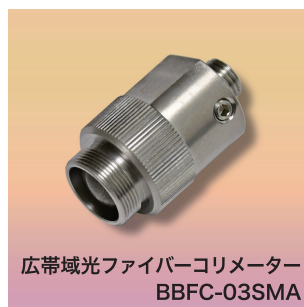
広帯域光ファイバーコリメーター BBFC-03SMA